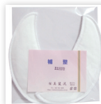
補整三日月薄型 1組 1,260円(税込)