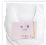
補整三日月厚型 1組 1,365円(税込)